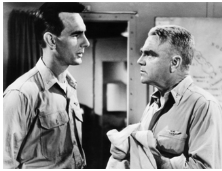
1960 LE HÉROS DU PACIFIQUE (The Gallant Hours) de Robert Montgomery avec James Cagney