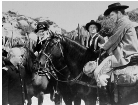
1953 L'HOMME DU NEBRASKA (The Nebraskan) de Fred F. Sears avec Wallace Ford, Philip Carey