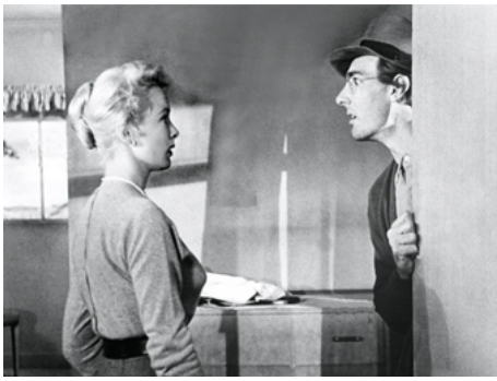
1958 LA SOIF DU MAL (Touch of Evil) d'Orson Welles avec Janet Leigh