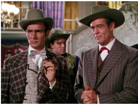
1952 LE TRAÎTRE DU TEXAS (Horizons West) de Budd Boetticher avec Robert Ryan