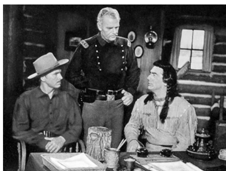
1955 LE GRAND CHEF (Chief Crazy Horse) de George Sherman avec John Lund, Victor Mature