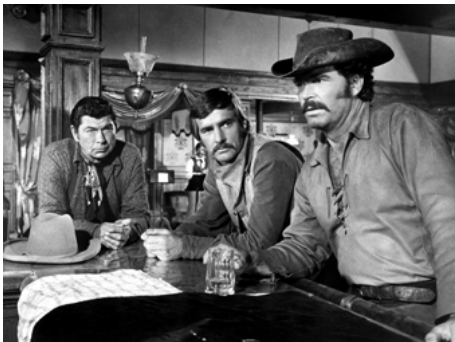
1970 UN HOMME NOMMÉ SLEDGE (A Man called Sledge) de Vic Morrow avec C.Akins, James Garner