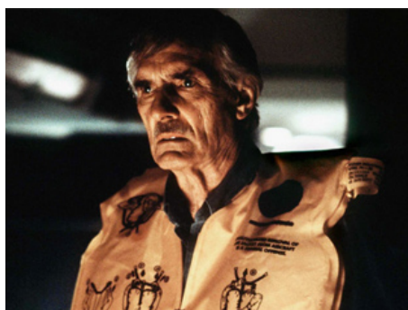
2000 CRASH DANS L'OCÉAN (Submerged) de Fred Olen Ray