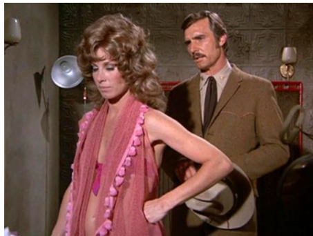
1970 UN SHÉRIF À NEW YORK (McCloud) de Richard A. Colla avec Stefanie Powers