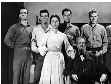
1955 7 HOMMES EN COLÈRE (7 Angry Men) de Charles Marquis Warren avec Ann Tyrell, J. Hunter, R. Massey