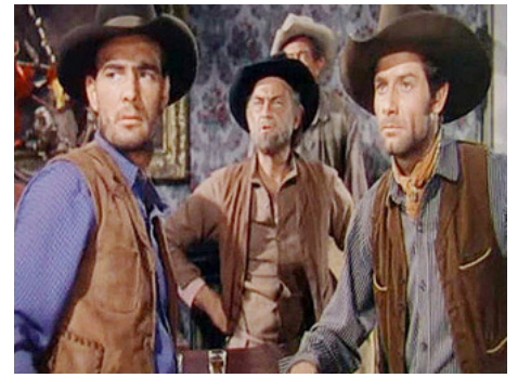
1953 VICTIME DU DESTIN (The Lawless Breed) de Raoul Walsh avec John McIntire, Richard Garland