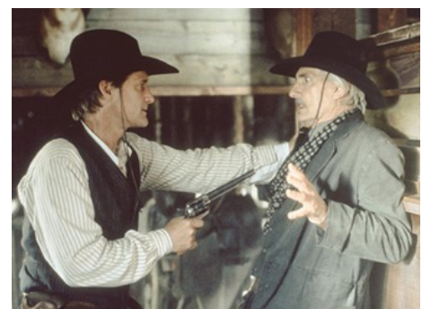
2000 LE VIRGINIEN (The Virginian) de Bill Pullman avec Bill Pullman