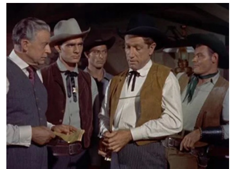
1955 DIX HOMMES À ABATTRE (Ten Wanted Men) de B. Humberstone avec Lee Van Cleef, R. Boone