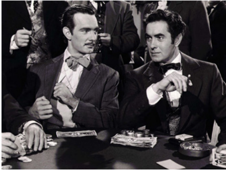
1953 LE GENTILHOMME DE LA LOUISIANE (The Mississippi Gambler) de R. Maté avec Tyrone Power