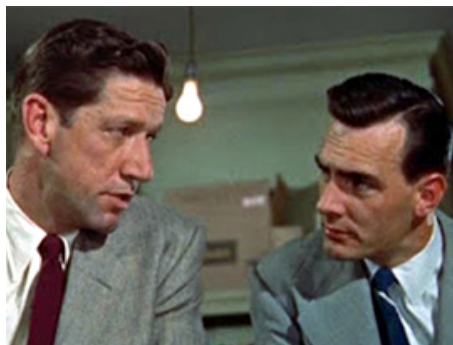
1954 LA POLICE EST SUR LES DENTS (Dragnet) de Jack Webb avec Richard Boone