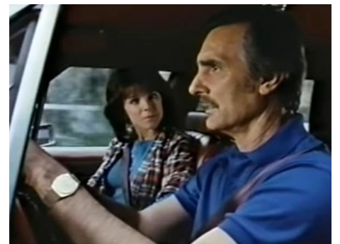
1982 L'ENFANT LUMIÈRE (Don't Go to Sleep) de Richard Lang avec Valerie Harper