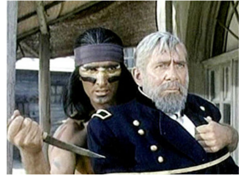
1953 L'HÉROÏQUE LIEUTENANT (Column South) de Frederick De Cordova avec Ray Collins