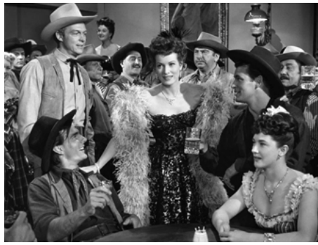
1953 LA BELLE ROUSSE DU WYOMING (The Redhead from Wyoming) de Lee Sholem avec A. Nicol, M. O'Hara