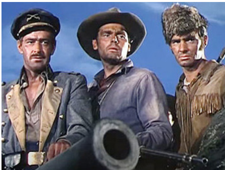
1953 LE DÉSERTEUR DE FORT ALAMO (The Man from the Alamo) de B. Boetticher avec A. Space, N. Brand