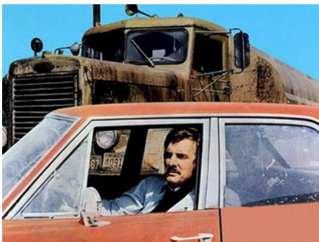
1973 DUEL (Duel) de Steven Spielberg