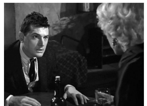
1955 LES VISITEURS MAUDITS (Storm Fear) de Cornel Wilde avec Lee Grant