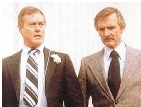
1977 CRY FOR JUSTICE de Bob Kelljan avec Larry Hagman