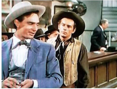
1953 QUAND LA POUDRE PARLE (Law and Order) de Nathan Juran avec Jack Kelly