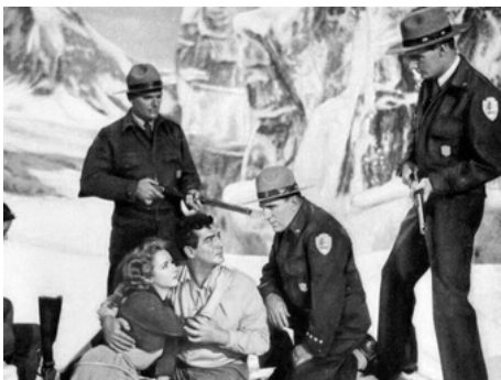
1954 MISSION PÉRILLEUSE (Dangerous Mission) de L. King avec Piper Laurie, V. Mature, W. Bendix