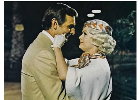
1971 WHAT'S MATTER WITH HELEN ? de Curtis Harrington avec Debbie Reynolds