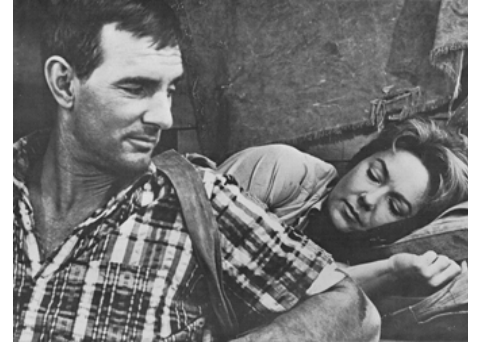
1968 MISSION BATANGAS (Mission Batangas) de Keith Larsen avec Vera Miles