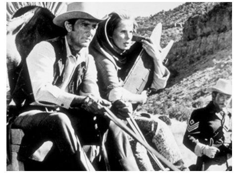
1966 LA BATAILLE DE LA VALLÉE DU DIABLE (Duel at Diablo) de Ralph Nelson avec Bibi Andersson