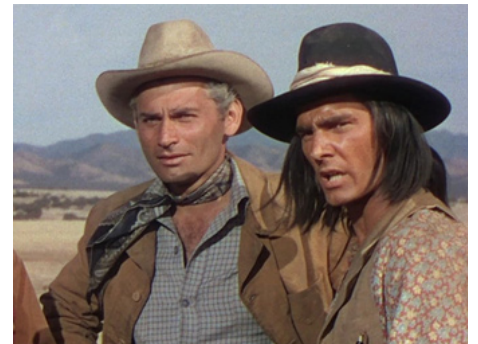
1953 À L'ASSAUT DE FORT CLARK (War Arrow) de George Sherman avec Jeff Chandler